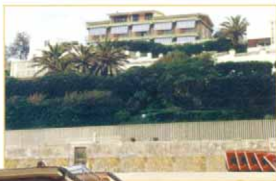
▲ Vista dalla spiaggia